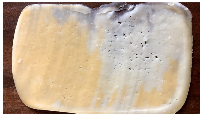
Figura III: Descoloração de urucum na região com olhos mecânicos.

O uso de fermentos bem ajustados com a curva térmica de fabricação, com boa atividade e em doses corretas, contribui com a fermentação e a sinérese. Não há dúvidas de que ambos, quando bem conduzidos são importantes para o controle do problema. A correria com a fabricação do Prato, fermentação insuficiente, entrada na salga com pHs mais elevados, etc. pode facilitar o aparecimento do defeito. Entende-se que a entrada na salga com um pH inferior a 5,40 é um fator que contribui para evitar o problema.