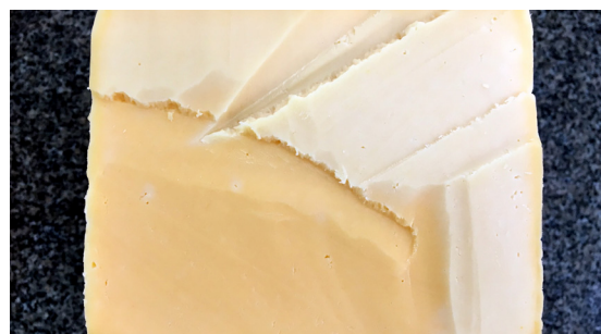
Figura II: Queijo Prato fatiado em bandeja.