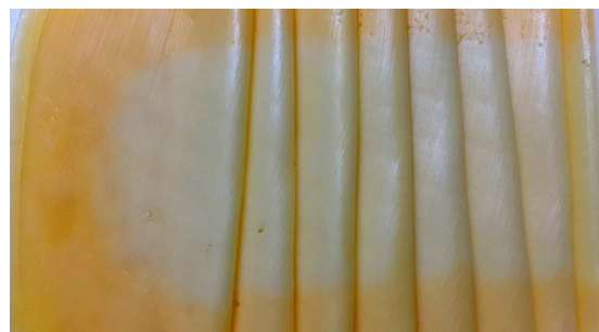
Figura III: Queijo Prato fatiado em bandeja.

mal prensadas. Prensagem insuficiente gera oclusão de ar/oxigênio nas olhaduras mecânicas facilitando a oxidação. A Figura III ilustra este fato com absoluta clareza.