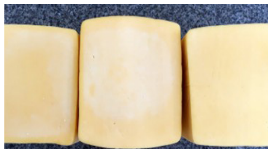
Figura I: Queijo Prato cortado e exposto ao ambiente.

Passando da teoria à prática, a experiência demonstra que no processo de fabricação, a pré-prensagem e a prensagem, quando insuficientes ou mal conduzidas, podem contribuir, com a ocorrência do problema. A afirmação se baseia no fato de que o defeito aparece com frequência nas olhaduras mecânicas presentes nas massas