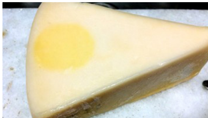
Figura IV: Descoloração de urucum.