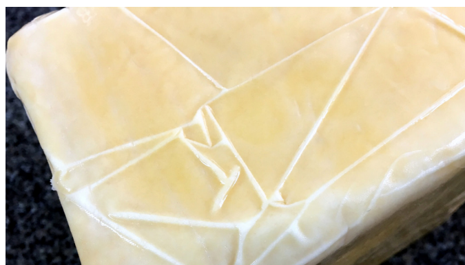
Figura V: Descoloração nos veios da embalagem por presença de oxigênio.